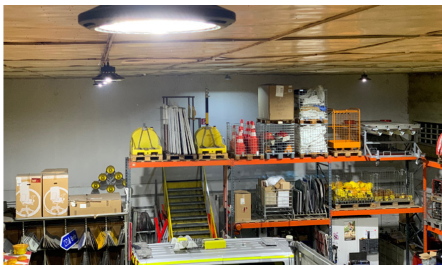
Die energieeffiziente LED-Beleuchtung sorgt für optimale Arbeitsbedingungen

Die Mitarbeiter des Unternehmens waren die Impulsgeber und Treiber für die umgesetzten Maßnahmen.