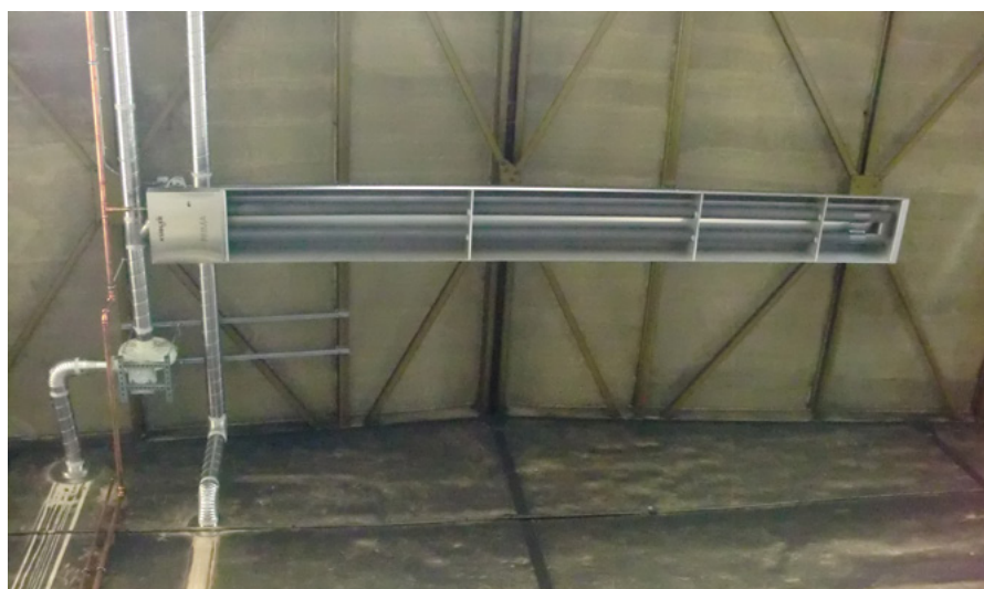
Die Hallenheizung erfolgt nun mittels moderner Deckenstrahler

Rewinkel Ingenieurgesellschaft mbH Humboldtstraße 6 39112 Magdeburg 03917358725